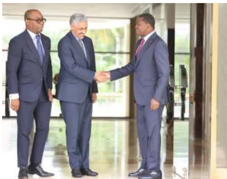
SEM Faure Gnassingbé recevant Sidi Ould Tah

Le Président de la République, Faure Essozimna Gnassingbé, s'est entretenu le 21 octobre 2024, avec le Directeur général de la Banque arabe pour le développement économique en Afrique (BADEA). Monsieur Sidi Ould Tah a partagé avec le chef de l'Etat, la situation de la BADEA et l'état du partenariat entre notre pays et son institution. « J'ai eu l'honneur d'être reçu par Son Excellence, Monsieur le Président de la République. L'objet de cette audience était de présenter à Son Excellence, la Banque arabe pour le développement économique en Afrique,