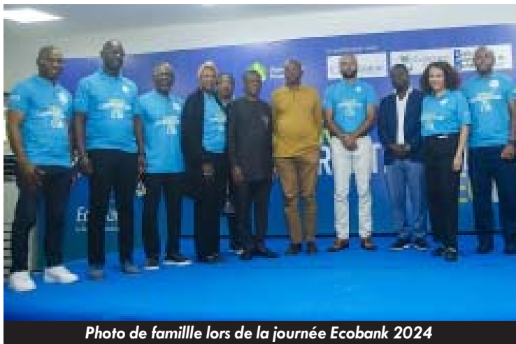
Photo de famille lors de la journée Ecobank 2024

Stimuler l'apprentissage à travers l'intelligence artificielle est une vision de la Fondation Ecobank qui s'inscrit dans la dynamique du projet triennal « Transformer l'Afrique par l'éducation » lancé en