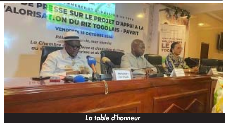
La table d'honneur

risation locale du riz, en encourageant la transformation et la commercialisation du produit sur le marché national. La CCI-Togo espère ainsi contribuer à l'autosuffisance alimentaire du pays tout en créant de nouvelles opportunités économiques pour les producteurs. Notre projet consiste à faire du riz togolais, une priorité de consommation locale en augmentant sa visibilité, en améliorant les actions de promotion et en mécanisant le processus de production et de transformation, l'initiative propose un ensemble de mesures d'accompagnement pour les producteurs et acteurs de la chaîne de valeur. Celles-ci incluent un appui technique, des formations pour améliorer les pratiques agricoles, l'accès à des financements pour moderniser les équipements et, surtout,