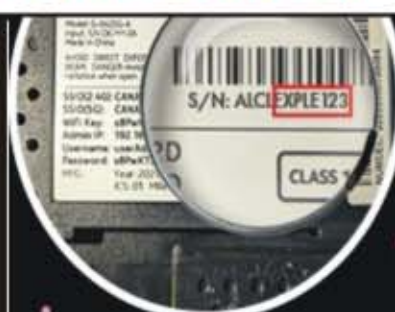
A L'ARRIÈRE DE LA BOX

L'OTR recrute 40 agents pour sa Direction des systèmes d'information