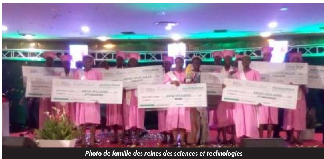
Photo de famille des reines des sciences et technologies